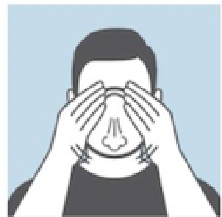
PERFORM A FIT CHECK: PLACE HANDS OVER THE RESPIRATOR AND EXHALE, ADJUST IF THERE ARE LEAKS