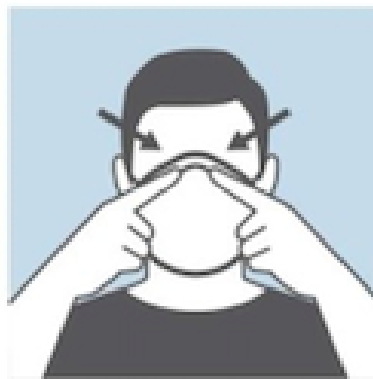
PRESS THE METALLIC WIRE TO FIT THE SHAPE OF YOUR NOSE AND FACE