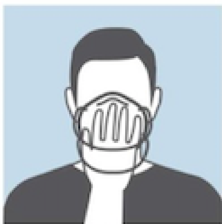
HOLD THE MASK IN YOUR HAND AND PLACE IT ON NOSE, MOUTH AND CHIN